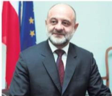
Polish envoy Maciej Lang said that Poland is among the EU member states that strongly support Turkey's EU negotiations, putting an emphasis on the long historical ties between the two countries.

"Young people will shape the future of our relations. I cannot overstate the importance of this exchange as a 'living bridge' connecting Poland and Turkey," Lang said, welcoming the high number of students visiting the country.