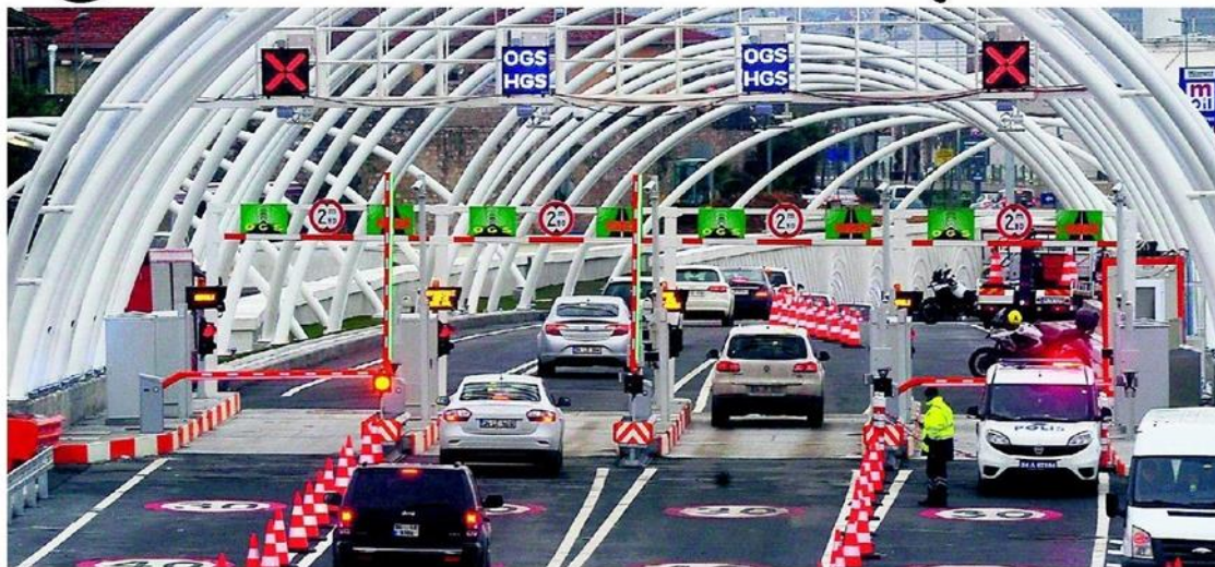
The Eurasia Tunnel was constructed in partnership between Turkey's Yapı Merkezi and SK E&C of South Korea, with an estimated $1.25 billion investment.