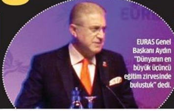
EURAS Genel Başkanı Aydın "Dünyanın en büyük üçüncü eğitim zirvesinde buluştuk" dedi.

53 ülkeden 2 binden fazla akademisyen İstanbul'da Avrasya Yükseköğretim Zirvesi'nde buluştu. Milli Eğitim Bakanı Yılmaz "Uluslararası eğitim alanında stratejik işbirliğine hazırız" diye konuştu.