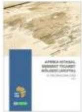
Afrika Kıtasal Serbest Ticaret Bölgesi ve Türk Firmalarının Etkisi" raporuna www.deik.org.tr adresinden ulaşabilirsiniz.