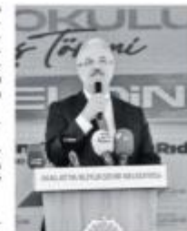
100 MİLYON LİRAYA BİTİRİLMESİ PLANLANAN BİR FABRİKA, 120 MİLYON LİRAYA MAL OLACAK.

Mertin, söz konusu emeklemede aralarla sohbet sırasında yüksek sesle konuştu: yürüyün bir fabrika yaptırmanın örnekleri ortaya koyuyor.