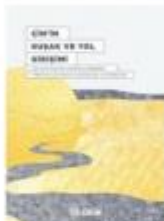
"Çin'in Kuşak ve Yol Girişimi COVID-19 Salgını Sonrası Dönemde Türkiye için Fırsatlar, Riskler ve Öneriler" raporunu www.deik.org.tr adresinden ulaşabilirsiniz.

D ış ticaretin en önemli aktörlerinden biri olan Çin'in, "Kuşak ve Yol Girişimi" ile dünyaya açılan kapılarının, Türkiye için fırsatlar ve riskler taşıdığı bir gerçek. Türkiye'nin bu fırsatları değerlendirirken, sadece altyapı projeleriyle değil, aynı zamanda dijital altyapı projeleriyle de ilgilenmesi gerekiyor. Çünkü dijital altyapı projeleri, sadece ticaretin hızlanmasını sağlıyor, aynı zamanda ticaretin güvenliğini de sağlıyor. Türkiye'nin bu fırsatları değerlendirirken, sadece altyapı projeleriyle değil, aynı zamanda dijital altyapı projeleriyle de ilgilenmesi gerekiyor.