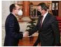
Bakan Muş, Budapeşte'de, Macaristan İnovasyon ve Teknoloji Bakanı Laszlo Palkovics ile bir araya geldi.

Muş, Türkiye'nin Afrika ile ticaretinde adil ticaret hedeflediğini ve bu doğrultuda kazan-kazan ilkesini benimsediğini, kıta ile ticari ve ekonomik ilişkileri geliştirirken sosyal ve kültürel anlamda da kotayla sıcak ilişkiler kurduklarını anlattı: "Şu an itibarıyla kıtada 43 ülkede büyükelçiliğimiz, 26 ülkede ticaret müşavirliğimiz bulunuyor.