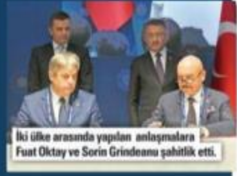
İki ülke arasında yapılan anlaşmalara Fuat Oktay ve Sorin Grindeanu şahitlik etti.

artırılacağını açıkladı. Oktay, Türkiye-Romanya ticaret hacmi hedefini, 2025 yılı itibarıyla 10 milyar dolardan 15 milyar dolara yükselttiklerini bildirdi. Oktay "Askeri ve savunma işbirliğimizi de güçlendireceğiz" dedi.