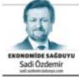
EKONOMİDE SAĞDUYU Sadı Özdemir www.ozdemirgazetesi.com

Genellikle iki çeyit yabancı sermayeden bahsedilir. Bir 'sıcak para' diğeri ise soğuk diğeri de bu da sermaye piyasalarıdır. Kim vakili sermaye olarak da tanınmaz ve daha çok hisse senedi, tahvil gibi yatırım araçlarıdır. Son dönemde bu tür yatırımların yoğunlaşması ya da azalışın iyi olduğu düşünülürken diğer bir yönü de yabancı sermaye yatırımlarının 'doğrudan yabancı sermaye' diye tanımlanan sanayi, ticaret, finans, turizm, ulaştırma ve hizmetler, gayrimenkul gibi yatırımlardır. Her iki temel kategoride de bu tür yatırımlara karşı olanların da görüşü önemlidir. Çünkü bu tür yatırımlar ülkemizi için istihdam, vergi gelirlerini ve ihracatı artırır, sermaye akışı sağlarken diğer yatırımları da artırır.