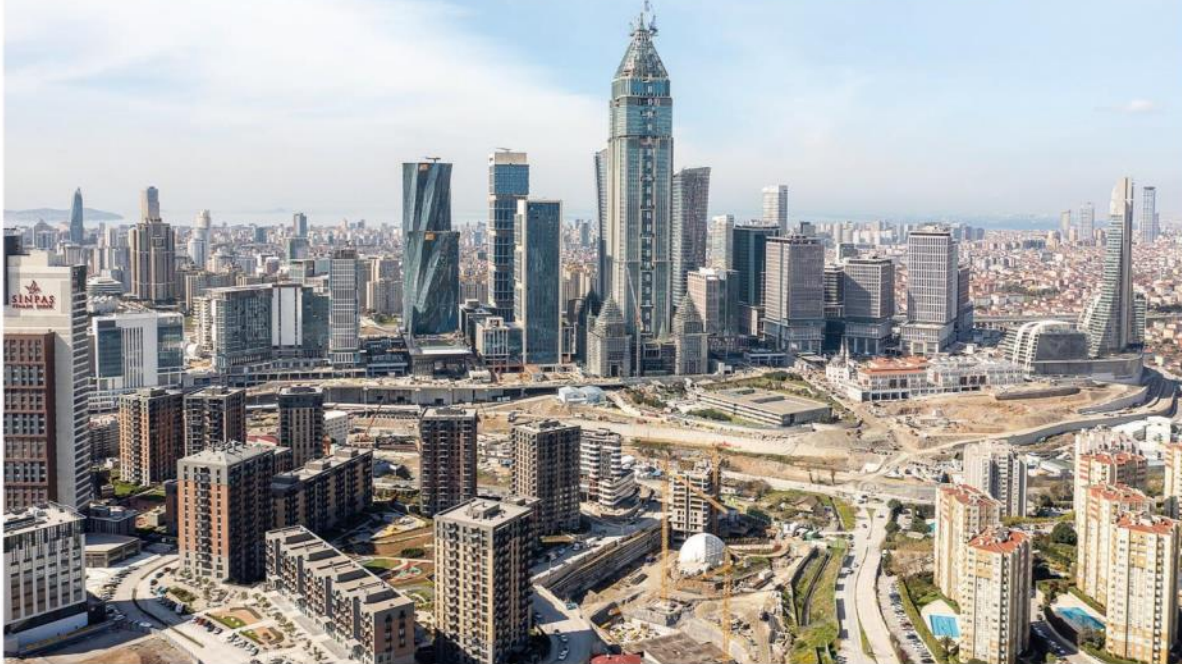
The Istanbul Financial Center, which was partly opened, will host the offices of a number of local and international institutions, including the Central Bank and Borsa Istanbul.