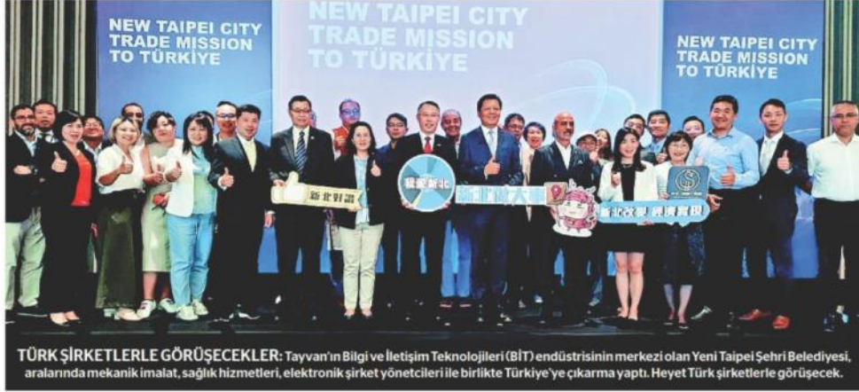
TÜRK ŞİRKETLERLE GÖRÜŞECEKLER: Tayvan'ın Bilgi ve İletişim Teknolojileri (BİT) endüstrisinin merkezi olan Yeni Taipei Şehri Belediyesi, aralarında mekanik imalat, sağlık hizmetleri, elektronik şirket yöneticileri ile birlikte Türkiye'ye çıkarma yaptı. Heyet Türk şirketlerle görüşecek.

300 BİN FABRİKANIN OLDUĞU YENİ TAIPEİ ŞEHİRİ BELEDİYESİ'NİN YÖNETİCİLERİ TÜRKİYE'DE