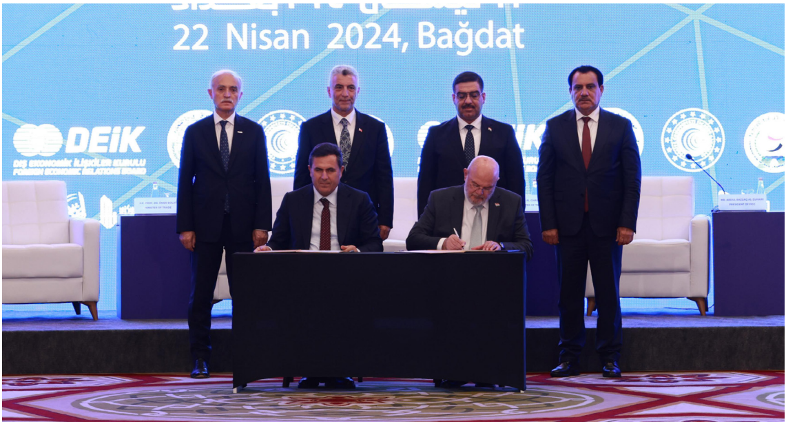
IRAK-TÜRKİYE YUVARLAK MASA TOPLANTISI: 13 YILIN ARDINDAN YENİ DÖNEM BAŞLANGICI

yılında ise 19,9 milyar dolar olduğunu vurgulayan Bakan Bolat, açıklamalarına, "Irak'a ihracatımız, 2023'te bir önceki yıla göre yüzde 7,2 azalarak 12,8 milyar dolar seviyesinde gerçekleşti. Aynı dönemde Irak'tan ithalatımız yüzde 31,1 düşüşle yaklaşık 7,2 milyar dolar oldu. Dış ticaret dengesi ülkemiz lehine olurken, dış ticaret fazlamız geçen yıl 5,6 milyar dolar düzeyinde hesaplandı. Cumhurbaşkanımızın