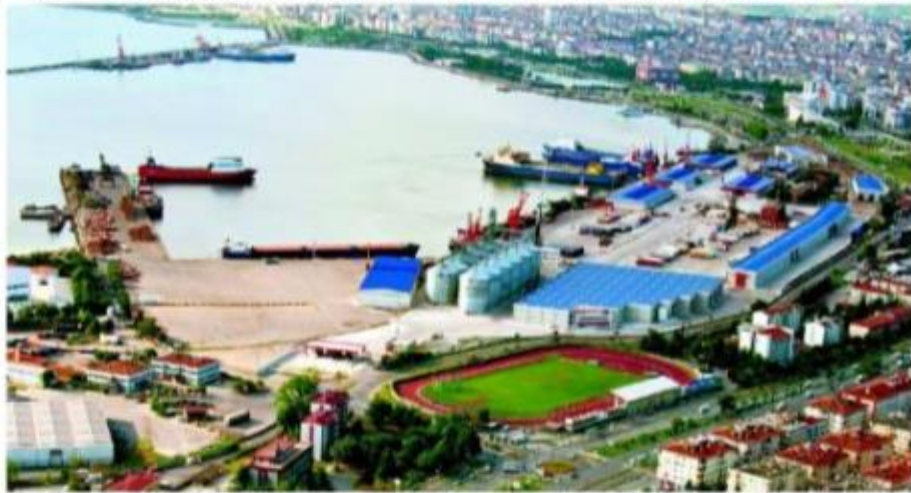
An aerial view of Samsun Port which resumed exporting Turkish goods to Russia in October 2016 after ties between Turkey and Russia started to normalize.

In addition to ornamental plants and products, the jewelry sector registered a staggering 207.4-percent increase from last year.