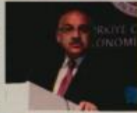
Mehmet BÜYÜKEKÇİ TTM Başkanı