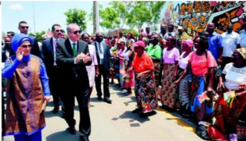
President Erdoğan, accompanied by his wife First Lady Beñur Erdoğan, greets the crowd during his visit to Mozambique to discuss on boosting the relations between Turkey and African countries, Jan. 24,