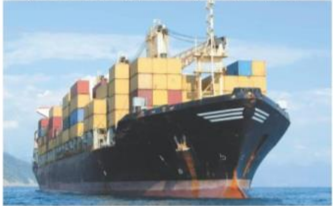
Rusya'ya gerçekleştirilen ihracatta 27 sektörden 24'ünde artış, 3'ünde ise azalış kaydedildi.

Kasım 2015'te Rus uçağının düşürülmesinin ardından yaşanan kriz nedeniyle sekteye uğrayan Rusya'ya ihracat, bu yıl yükselişe geçerek Ocak-Ağustos döneminde 1 milyar 556 milyon dolara ulaştı. Yaşanan iyileşme ile bu ülkeye ihracat yüzde 52,5 artmış oldu.