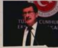
Andrey PODELYSHEV Rusya İstanbul Başkonsolosu

memnuniyetiyle dile getiren Büyükekçi , Türkiye'nin 2023 için 500 milyar dolar ihracat ve dünya dış ticaretinden yüzde 1,5 pay alması hedeflediğini de ifade etti.