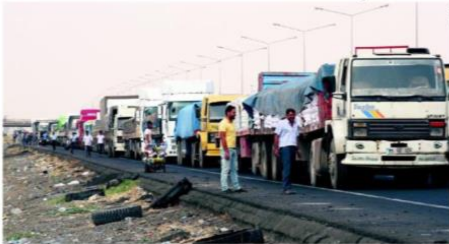
Trucks wait in line to pass Habur border gate near the town of Silopi at the Turkish-Iraq border.

Highlighting that every conflicted region has political repercussions, Minister Tüfenkci said that the Turkish government is working to generate alternatives to prevent any damage in trade with Iraq if the Habur Border Gate is closed. Using air routes or the Eseneere Border Gate, Turkey's border with Iran, could be among options to bypass the regional government. The minister noted that the government would do its best to maintain the safe flow of