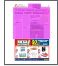
Merkeste açılışa katılan Bakan Zeynepçi Türk firmalarıyla bir araya geldi.

Tarih: 23.09.2017 Sayfa: 5 Tiraj: 129199 StxCm: 243