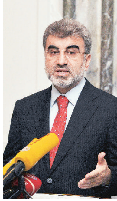
Enerji ve Tabii Kaynaklar Bakanı Taner Yıldız, Türkiye'nin Yemen'den LNG ve nafta almak istediğini söyledi.

Petrol ve Madeni Ürünler Bakanlığı'nın şirketlerin ve yatırımcıların teşvik edilmesine yardımcı olacak bir veritabanı oluşturmak üzere araştırmalar yapmak istediğini ifade eden