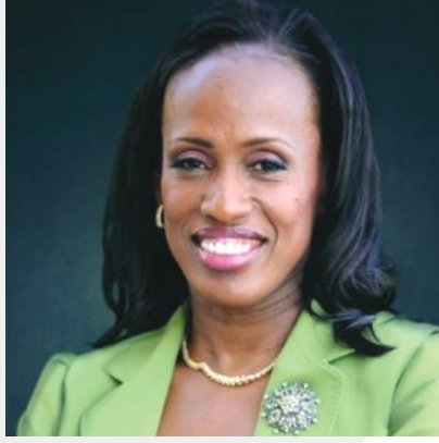
JACKIE JOYNER-KERSEE Genel Kurul Başkanı