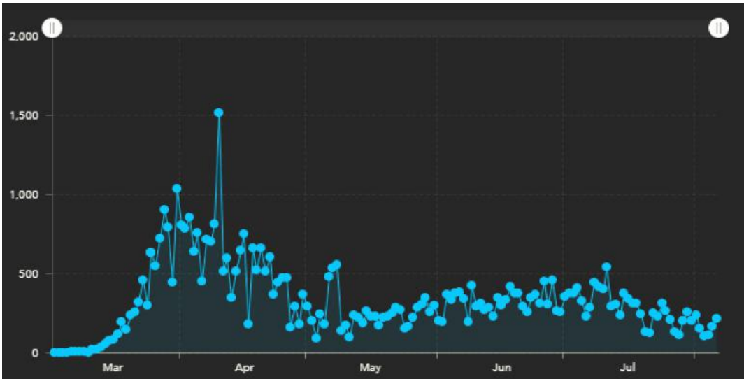
Yeni vakaların gelişimi (günlük)