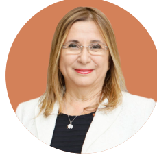
RUHSAR PEKCAN T.C. Ticaret Bakanı

Navlun desteğinden bahsederek söze başlayan Bakan Pekcan, söz konusu desteği sadece havayolu taşımacılığı için sağlayacaklarını, Cumhurbaşkanımız tarafından onaylandığını, 30 Haziran 2020 tarihine kadar geçerli olacağını ifade etti. Pekcan, Türk Eximbank'ın sigorta kapsamında çalışmalarını çok genişlettiklerini, hatta sigorta genel müdür yardımcılığı oluşturduklarını ve alıcı sigortası çalışmalarının olduğunu söyledi. Lojistik merkezleri konusunda Afrika kıtasında çalışmaların Gana'da belirli bir aşamaya geldiğini söyledi. Konuyla ilgili Bakan Yardımcısı Gonca Batur'un bilgi vereceğini ifade eden Pekcan, İş Konseyi Başkanlarının ayakları yere basan bir proje ile gelmesi halinde değerlendirebileceklerini vurguladı. Ticaret Müşavirleri noktasında her zamankinden daha aktif bir sisteme sahip olduklarını belirten Pekcan, "Müşavir Ağı programı ile Ticaret Müşavirlerimiz artık bütün aktiviteleri sisteme giriyor" dedi. 2019 verilerine göre, ülkemizin ihracatının 180 milyar dolar, ithalatının ise 210 milyar dolar olduğunu belirten Pekcan, "Ekonomi daha çok ithalata dayalı, şu anda uyguladığımız gümrük vergileri ise pandemi ile alakalı. Belirli ürünlerin Türkiye'de de yapılabileceğini artık idrak etmemiz gerekiyor" dedi.